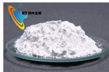
氧化钇 CAS NO.1314-36-9